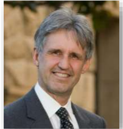
Ian Morris a Stanford Egyetem klasszika-filológia és történelem tanára