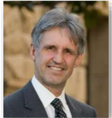
Ian Morris a Stanford Egyetem klasszika-filológia és történelem tanára

„A világ gyorsabban változik, mint bármikor korábban, még hozzá sokkal gyorsabban...”