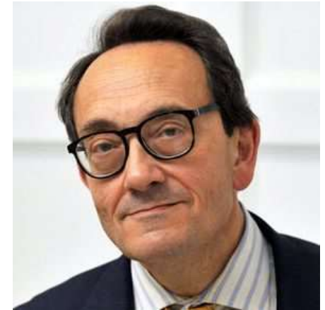
Felipe Fernández-Armesto történész, az indianai Notre Dame Egyetem tanára

„A gyorsuló változás legnagyobb [...] jele az egy főre jutó fogyasztás volt, amely globális szinten a hússzorosára nőtt a 20. század során.”