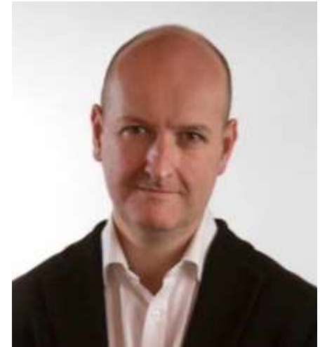
Ian Mortimer történész, író

„Egy másik kérdéssel kell kezdenünk: mit értünk a ‚világ’ alatt? Néhány régió jóval korábban élte át a leggyorsabb fejlődést.”